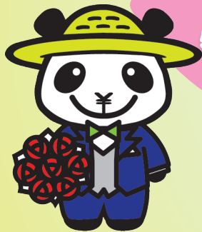
JAバンクえひめキャラクター ばんじゃくん